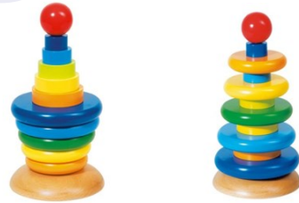
Erref, kttk019 26zm. Egurra. Madera.