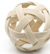
Erref. Kttk001 8zm edo 10zm. Zumea.