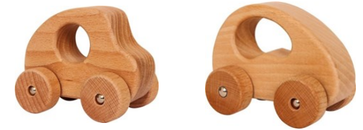
Erref. Kttk016 10zm. Egurra Madera

Egurrezko auto hauek, hertz guztiak borobilduak dituztenak, esku txikiengatik erraz maneiatuak izateko bereziki diseinatuak daude.