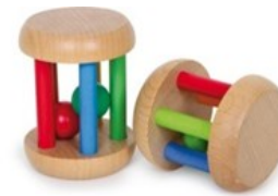
Erref. Kttk007 6,5zm/8,5zm. Egurra. Madera