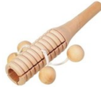
Erref. Kttk006 16zm. Egurra. Madera