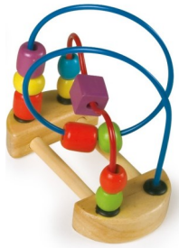
Erref. Kttk013 Metala eta egurra . Metal y madera.