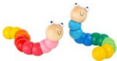
Erref. Kttk008 17 Zm. Egurra. Madera. 3€