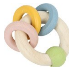
Erref. Kttk011 6,5zm. Egurra. Madera 5,5 €

Pensado para chupar, moder, agitar y examinar. Emite un sonido agradable. Favorecedor de la manipulación y la habilidad ojo-mano-boca.