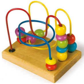
Erref. Kttk012 7-9zm. Metala eta egurra . Metal y madera.