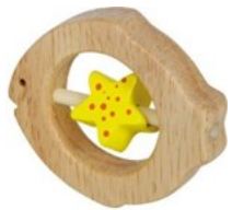
Erref. Kttk004 7,5zm. Egurra . Madera 3€

Pensado para chupar, morder, agitar y examinar. Gracias a su diseño, tiene un sonido muy agradable. Favorece la manipulación y la habilidad ojo-mano-boca.