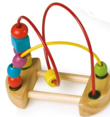
Erref. Kttk014 Metala eta egurra . Metal y madera.