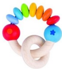
Erref. Kttk009 6,5zm. Egurra. Madera 4,5€

Pensado para chupar, morder, agitar y examinar. Favorecedor en las primeras fases de exploración y de la habilidad ojo-mano-boca.