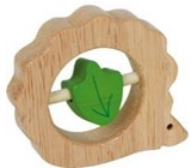
Erref. Kttk005 7,5zm. Egurra . Madera 3€