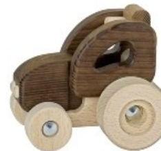
Egurrezko traktorra Tractor de madera

Todos los bordes están redondeados Diseñados especialmente para que las Manos pequeñas puedan manipular.