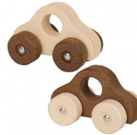
Erref. Kttk015 13,5zm. Egurra Madera