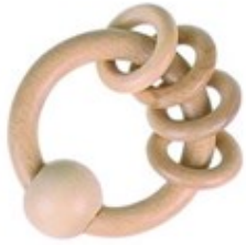
Erref. Kttk003 6€ 12zm. Egurra Madera