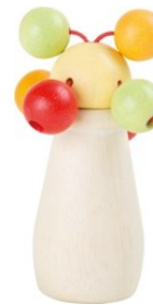
Erref. Kttk010 17 Zm. Egurra. Madera. 6€