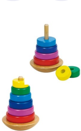
Erref. Kttk018 14zm. Egurra. Madera.