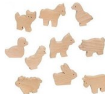
Erref. Kttk002 5,5-6,5zm. Egurra